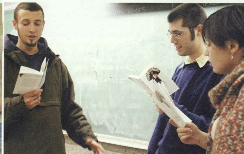
◀ Aide moi à faire seul, Bacchus club, Epicuria, EBI's Show, et bien d'autres encore animent une vie étudiante riche en activités.